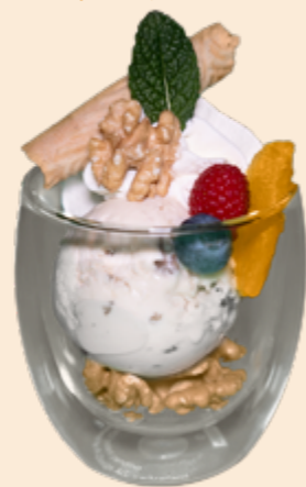
Kreation Nussknacker Baumnuss-Rahmglace mit Baumnüssen und Rahm Fr 6.90