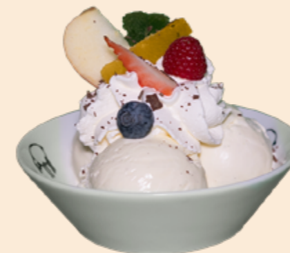
Coupe Dänemark Vanille-Rahmglace mit Schoggisauce und Rahm Fr 12.20