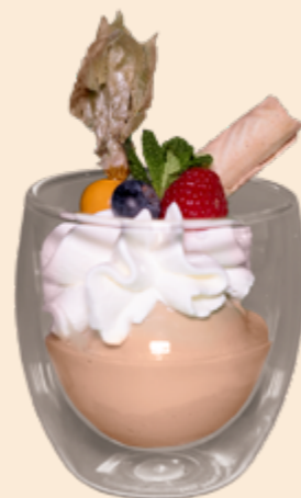
Kreation Kafiklatsch Café-Rahmglace mit Baileys und Rahm Fr 8.90