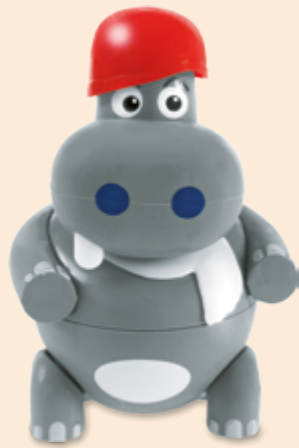
Hippo Erdbeer-Glace Fr 6.50