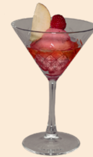
Sorbet Vieille Prune Zwetschgen-Sorbet mit Vieille Prune Fr 13.20 Kleines Sorbet Fr 9.20