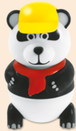
Panda Vanille-Glace Fr 6.50