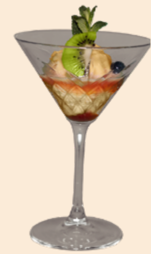
Sorbet Veneto Mango-Sorbet mit Passoa Fr 13.20 Kleines Sorbet Fr 9.20