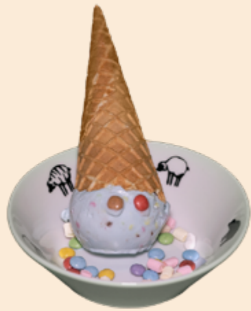
Coupe Clown Konfetti-Rahmglace mit Smarties und Rahm Fr 5.50