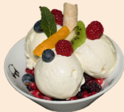
Ewigi Liebi, das wünsch ich mir.... Vanille-Rahmglace und warme Waldbeeren Fr 13.60