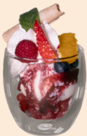
Kreation Waldbeeren Hot-Shot Vanille-Rahmglace, warme Waldbeeren, Beerensauce und Rahm Fr 8.20