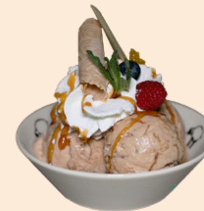
Coupe Caramelita Caramel-Rahmglace, Caramelsauce und Rahm Fr 11.90