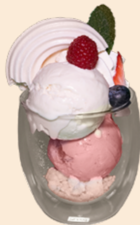
Kreation Meringues Crème de Gruyère-Rahmglace und Erdbeer-Rahmglace, Meringues-Stücken, Himbeersauce und Rahm Fr 9.90