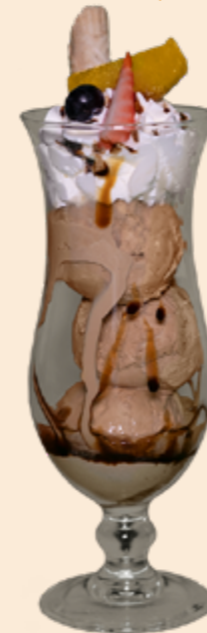
Ice Café Café-Rahmglace mit Rahm Fr 11.20 Mit Kirsch und Rahm Fr 13.30