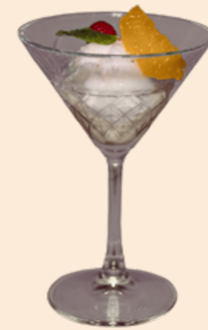
Sorbet Colonel Zitronen-Sorbet mit Vodka Fr 13.20 Kleines Sorbet Fr 9.20