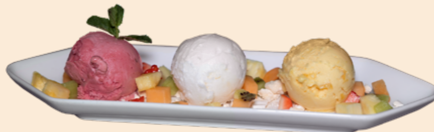
Trio Sorbet Schäfli Mango-, Zitronen-, und Zwetschgen-Sorbet mit Früchten Fr 12.90