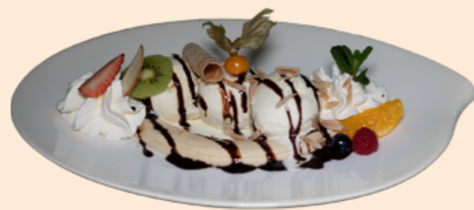
Bananensplit Vanille-Rahmglace mit Bananen, Schokoladensauce, Mandelsplittern und Rahm Fr 13.20