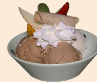
Coupe Baileys Vanille- und Café-Rahmglace mit Baileys und Rahm Fr 13.20