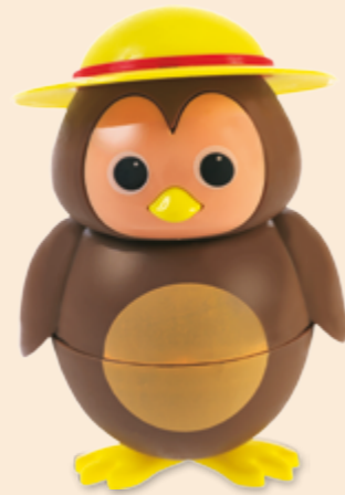
Birdy Schokolade-Glace Fr 6.50